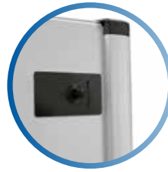
Monedero de cambio de 6 tubos