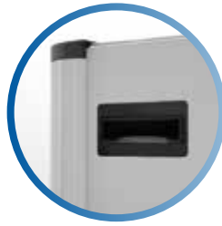
Lector de billetes