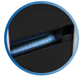
Iluminación led en salida de producto